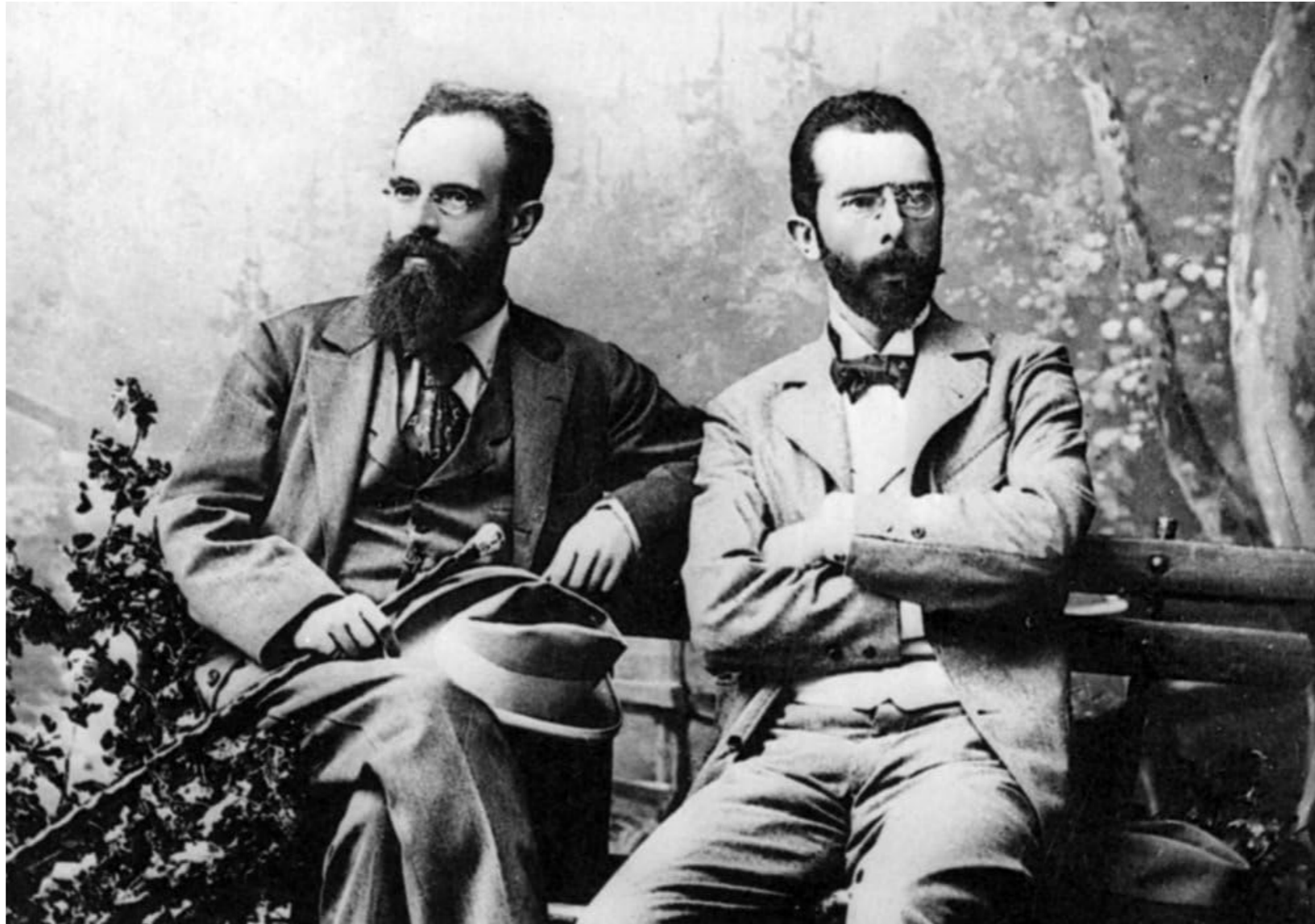
Franz Schalk (1863-1931) und Joseph Schalk (1857-1900)