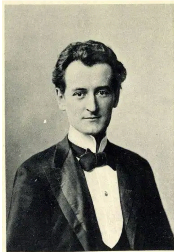
Karl Muck (1859-1940)