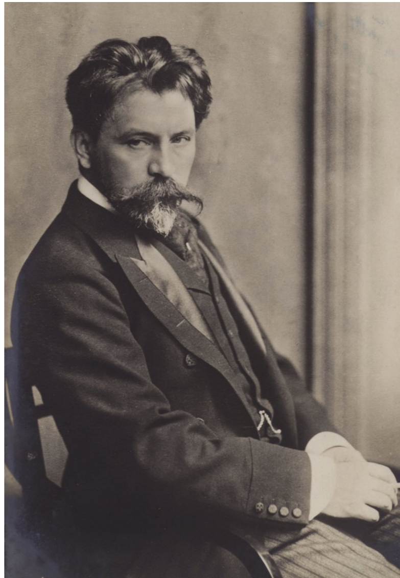
Arthur Nikisch (1855-1923)