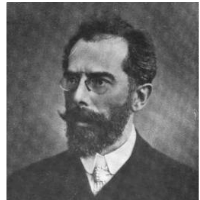
Franz Schalk 27. Mai 1863 – 3. September 1931

UA mit Orchester (Schalk-Bearbeitung) 9. April 1894, Graz